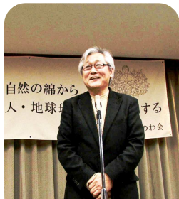
前島代表 開会のあいさつ

きつといい年になる吉兆と、何事もポジティブに考えたいですね。さて1月28日(土)に、