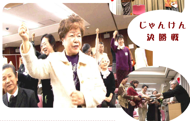
じゃんけん 決勝戦