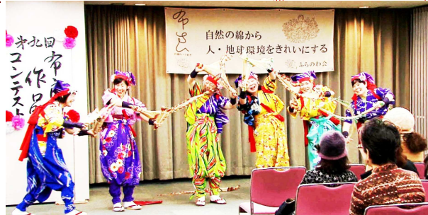
「南京玉すだれ」めてたい。みんなを元気な笑顔に