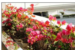
ブーゲンビリア 沖縄