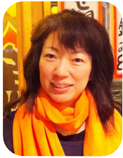
早速、八丁堀の本部に出向き、すっ”つと動くのです・・・。

昨年12月の誕生日に、お友達から布良・大判クロスをプレゼントして頂きました。寝る時に襟もとに掛けて寝た所、目覚めがいつもと違う事に気がつきました。息子のお弁当作りのため、毎朝5時に起きるのは辛く、いつも気合いを入れて起きていたのですが、目覚ましのアラームを止めると同時に「身体が」すっ、すっ”つと動くのです・・・。