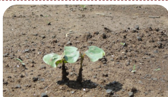
早くも芽が出てきた