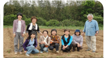
マスターコースの方々