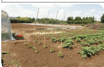
奥が綿畑 手前野菜畑