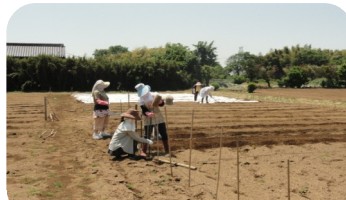
うねづくりをしている