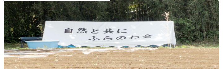
新調したサポータークラブのテント(柱折り曲げた状態)