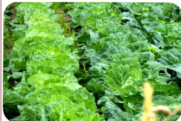
美味しいキャベツ