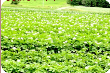
北海道でっかいどう。