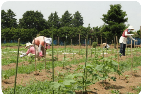
台風の風に備え、綿に支え棒をとりつける作業をしている マスター会員 猛烈な暑さの中ご苦労様でした。前島