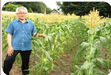
葉の色の違いでわかる。

3種類の大きさの箱/価格を用意し、 申し込みは随時受け付けます。中身の野菜 は、農園におまかせ。申し込みがあった時 点で、畑で一番よい状態のものをセツトし て発送いたします。北の大地から何が届く か、どうぞお楽しみに！