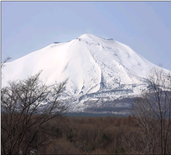
熱帯夜の連続記録 この山を見てると涼しい風が吹いてきますよ。ああ～熱帯夜

オリンピックの熱気、そして夏の酷暑の余韻が続いています。夏バテしていませんか？ お陰さまで、マリムーンベジタブルも好評で、食欲の秋に、衣食住が揃ったふらのの暮らしをお届けできるようになりました。 こうした新商品のチカラも手伝って、もうすぐふらののわ会の会員が1万人を突破！します。 創業11年、実にゆっくりな歩みながら、会員1万人目の登録が目の前に迫ってきました！。 (冬の浅間山)