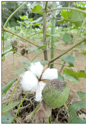
少しづつ収穫が始まりました。見に来てね。

収穫までの苦勞 布良の畑で綿を栽培するようになり、綿を育て、収穫するまで育てるのに、いかに手間と愛情が必要かということがよくわかりました。 今年は大風のせいで塩害になり、いつときは、もうダメか〜と思ったから、なおさらです。