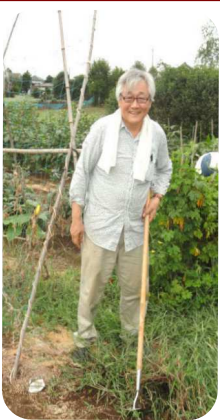
暑さも野菜もすくすく育ちました。前島。夏場の草取りは暑さを消費し、畑の綿も元気に育ちました。

この考え方を広め、もっと多くの会員にハッピーの環・輪・和に参加し、利用していただけるような「しくみ」を、来春をめどに発表予定です。どうぞご期待ください。