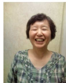
心を頂けま した。 自然の中 での食事は おいしく、

ウグイスやヒバリの鳴き声、 心地良い風に心が癒されました。 皆さんの愛情込めて種まきをす る姿を拝見して、そしてほんの 少しですが種まきの体験をして、 「大切に布を使わなくては」の