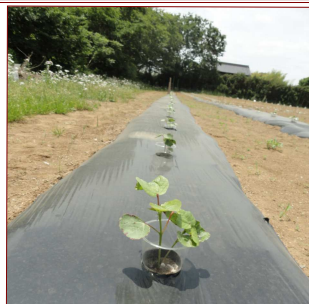
今年の成長は順調ですよ。 ふらのわ研究農園から