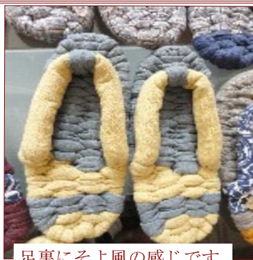
足裏にそよ風の感じます