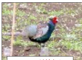
ときにきじが綿畑に

ふらそら3と4に、通常サイズよりも幅がそれぞれプラス5cmワイドなWサイズがあるのをご存知ですか。愛用している方から「たつぷりと使いやすく、ジョギングにぴったり」「腹巻にしやすいサイズ」「お風呂上りに髪や身体を拭くのちようどよい」など、好評をいただいています。そこでこのWサイズをもつとお