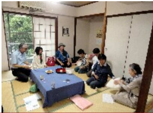
熊本市 環ヨーガ教室でのつどい 明るく打ち解けた感じです。