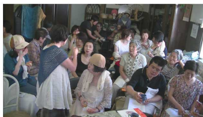
札幌のつどい なごやかです