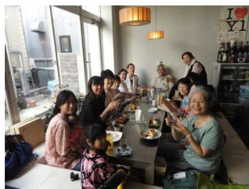
福岡のつどい 明るいです