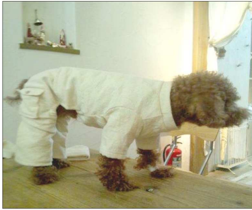
なんてファッションナブル！ 治療しているなんて思えませんね。 動物の気持ちがわかる新妻先生だからこそその デザインだと思いました。