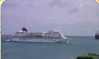
外国航路の客船 若いころ船員をしていた思い出が蘇る 那覇港にて 前島