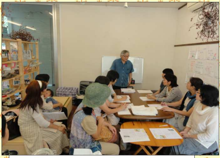
旭川市のつどいツムギテにて