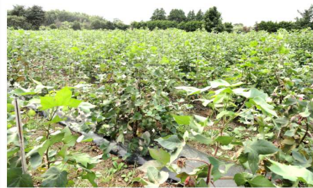
生き生きとした波動に包まれてるから裸足 で歩くと疲れが取れるよー 船橋にて。