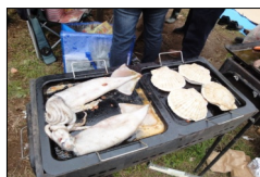
イカと帆立札幌より