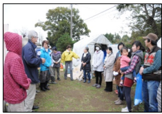
始めの挨拶が長い