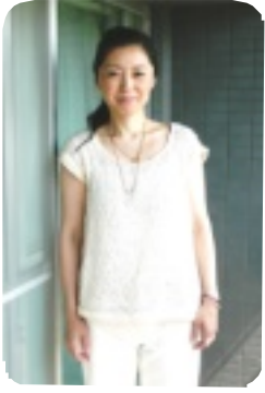
編んで着た糸のニット 自分で紡いだ糸を着て

ふわふわのコットンボールから一本の糸へ…。日々、あたり前のように手にしている、一本の糸。今では、その糸を見る目が、大きく変わりました。一粒の種から、それらを育む大地があり、自然界の恵みがあり、それらを大切に育ててくださる人々がいて、そして、その綿達を、時間をかけて糸にしてくださいる人々がいて、今、私の手元にこの糸がある。それは、ただただ、感謝のみ。 私は、今年初めて、自分の手で糸を紡ぐという体験をしています。最初は綿毛がぶつぶつと切れ、糸になる気配もありませんでした。