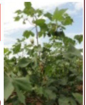
7月の綿の様子。 花が咲きはじめてました