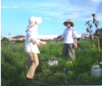
マスターコースの綿のお世話

草取りがはかどった後の一休み。畑で採れたスイカを割っていただきました。スイカの中身は白かったけど、なぜか美味しく感じました。「夏の思い出」