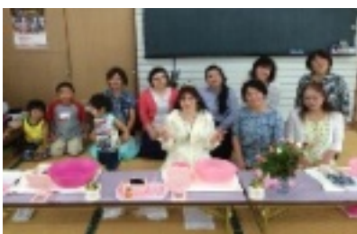
参加者で記念撮影。子どもたちも参加しました

「布良の話をしてから、フェイシャルパックに。あっという間の3時間半でした。みなさんとても喜んでいただき、お話しがはずんで、なかなか帰れなかったほど。また開いてくださいと言っていたいたんですよ」と、うれしい報告。写真も送ってくれました。参加者の感想は、あらためて送ってくれるそうで、楽しみです。