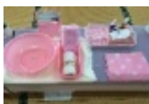
ピンクのグッズで統一。ますますハッピーにきれいになりますね