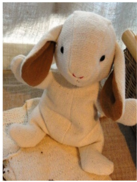
ぐるぐるやして可愛いらしいねえ、ふらのわ会報のうさぎちゃんです。可愛いらしいねえ、ふらのわ会報のうさぎちゃんです。