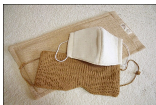
山本さん愛用のマリムーンスペシャルとマリムーンアイマスク・マリムーンクチマスク