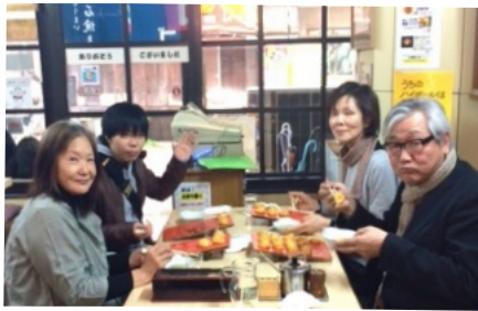
明石の名物は本当に美味しかったですね 明石駅の近くのお店にて

明石周辺の方にも布良を知ってもらおうと思い、Facebookを使って地元の方に告知が出来ること知って、私はFacebook教室に通いました。地元でのイベントの掲示板に布良のつどいの告知が出来るようになりました。つどいの当日は残念ながら私