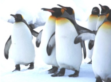
ペンギンの散歩は超人気 旭川動物園にて