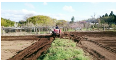
大型トラクターでの深耕

毎週土曜日(日曜の時もあり)、ふらマスターコースのメンバーが畑で作業をします。メンバー以外でも「綿畑ボランティア」大歓迎!!参加、見学希望は東京サロン(03-5540-8511)へご相談ください。綿や野菜が頂けるよー。糸紡ぎや農法が学べます。自然に触れてリフレッシュできる。