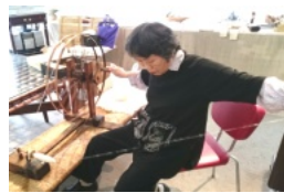
糸車で手紡ぎの作業