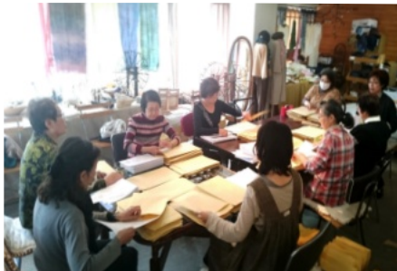
毎月、会報の袋詰め作業を行ってくださる ボランティアの会員さん